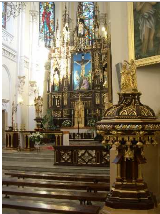
13. WPISUJĄCY DANE