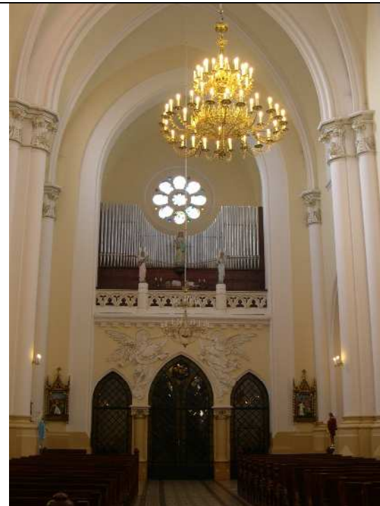
14. DATA WYKONANIA EWIDENCJI 2.03.2010