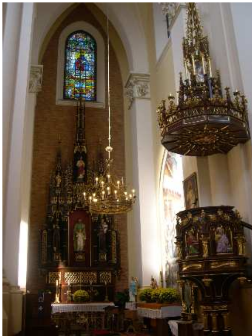
12. STAN ZACHOWANIA dobry